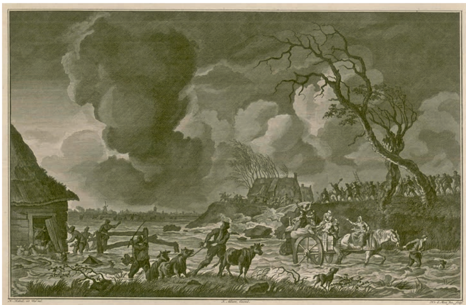
Afb. 2 Overstromingen nabij Vollenhove in 1776.