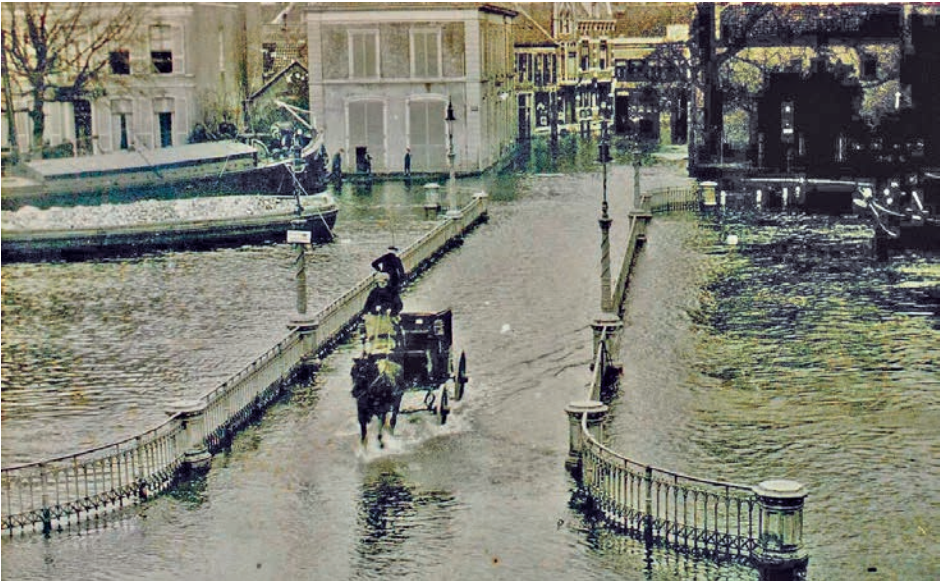
Afb. 4 Overstroming in Zwolle van de Potgietersingel en Eekwal in 1916.

van particuliere instanties. De overheid hield zich op de achtergrond. Terwijl het voor velen duidelijk was dat zonder overheidsgelden een dergelijk groot project niet te realiseren zou zijn. Het was dus zaak om het Rijk hiervoor te interesseren. Op initiatief van het Friese kamerlid Age Buma ontstond daarom in 1886 de Zuiderzeevereeniging. Buma had in de Tweede Kamer al eerder getracht de geesten voor afsluiting rijp te maken. Een in 1882 door hem ingediend voorstel werd vanwege het ontbreken van een financiële onderbouwing verworpen. 5 Nadat hij onvoldoende gehoor in de Tweede Kamer had gevonden, wilde hij medestanders buiten het parlement zoeken. In 1884 had hij contact gezocht met mr. P.J.G. van Diggelen. Op het station van Zwolle hadden beide mannen elkaar getroffen. Van Diggelen was naast rechter ook gemeenteraadslid van Zwolle en lid van de Provinciale Staten van Overijssel. Net als Buma was hij liberaal. Zijn vader was de al eerdergenoemde ir. B.P.G. van Diggelen. Affiniteit met het onderwerp kon hem dus niet ontzegd worden. Op 4 januari 1886 vond in Amsterdam de oprichting van de Zuiderzeevereeniging plaats. Volgens de in april aanvaarde statuten luidde haar doelstelling: ‘technisch en financieel onderzoek aan te leveren waardoor afsluiting en later drooglegging van de gehele Zuiderzee, de Wadden en de Lauwerszee wenselijk en uitvoerbaar is.’ 6