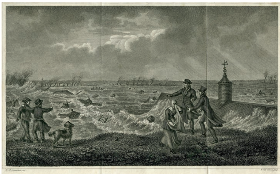
Afb. 3 Overstroming nabij Hasselt in 1825.

werden 2.284 gebouwen zodanig beschadigd dat ze onbewoonbaar waren geworden. Meer dan 13.000 runderen verdronken. 3 Na deze ramp is Overijssel bijna een eeuw lang voor grote overstromingen gespaard gebleven. Maar in 1916 was het weer raak. In deze contreien vielen geen doden, maar grote delen van Overijssel stonden wederom onder water. De overstroming van 1916 was echter de laatste grote watersnoodramp in het Zuiderzeegebied.