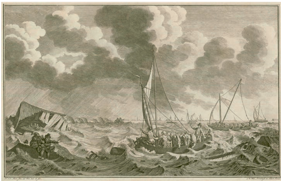
Afb. 1 Overstromingen nabij Kampen in 1775 (collectie HCO).

Op 21 maart 1918 werd door de Tweede Kamer zonder hoofdelijke stemming de Zuiderzeewet aangenomen. Nadat op 13 juni ook de Eerste Kamer had ingestemd kon een dag later de wet in het Staatsblad worden afgekondigd. Dit artikel gaat over de standpunten die in Overijssel in de voor afsluiting pleitende Zuiderzeevereeniging werden ingenomen en over de na de inpoldering gegroeide banden met het nieuw gewonnen gebied.