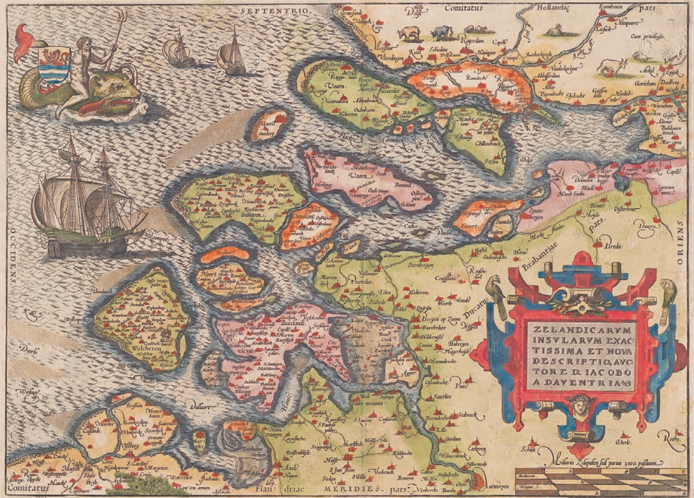
Afb. 1 Kaart van Zeeland, uitgegeven door Abraham Ortelius in 1570 naar de kaart van Jacob van Deventer uit 1545.