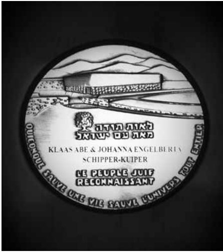
Afb. 1 Postume Yad Vashem onderscheiding in 2015.