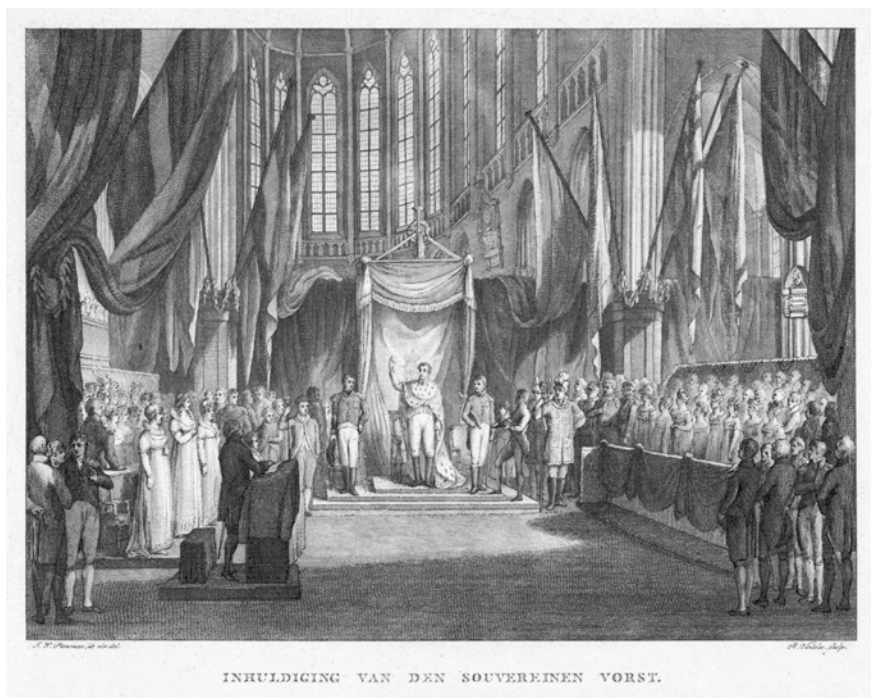
De inhuldiging van koning Willem I. Prent door Reinier Vinckles.

eel gebied, langzaam maar zeker motoriseerde en nationale en etnische identiteiten herontdekte. De eeuw begon slecht voor Nederland, dat zich tussen 1801 en 1813 (en vooral in de periode 1810-1813) had moeten schikken naar de wensen van dictatoriaal Frankrijk. Overal in Europa lieten de Napoleontische oorlogen een spoor van vernieling achter. Nederland moest zichzelf opnieuw zien uit te vinden. Dat bleek moeilijker dan gedacht. Eenmaal bevrijd uit de Franse wurggreep werd de zoon van de in 1795 gevluchte stadhouder Willem V in 1813 teruggehaald uit Londen en in 1815 geïnstalleerd als koning Willem I der Nederlanden. Het democratische experiment van de revolutie was definitief mislukt.