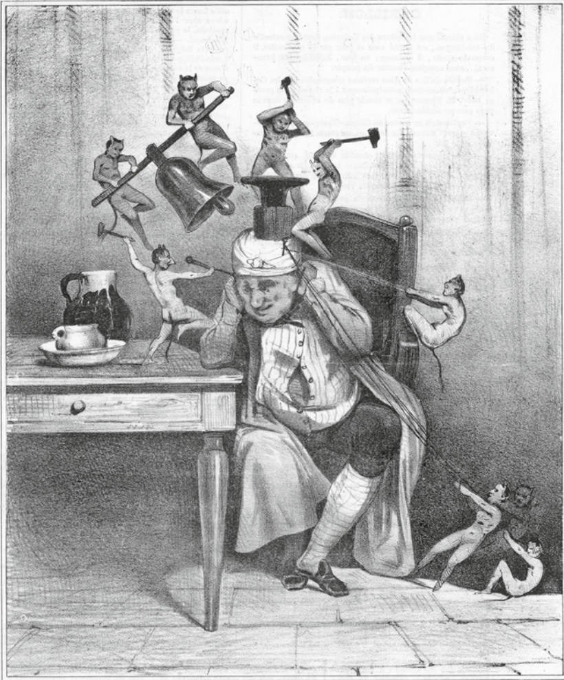
Le mal de tête.

Hola! hola!... pan'pan!... dindredindou - dindredindou. hola! hola! hola!!