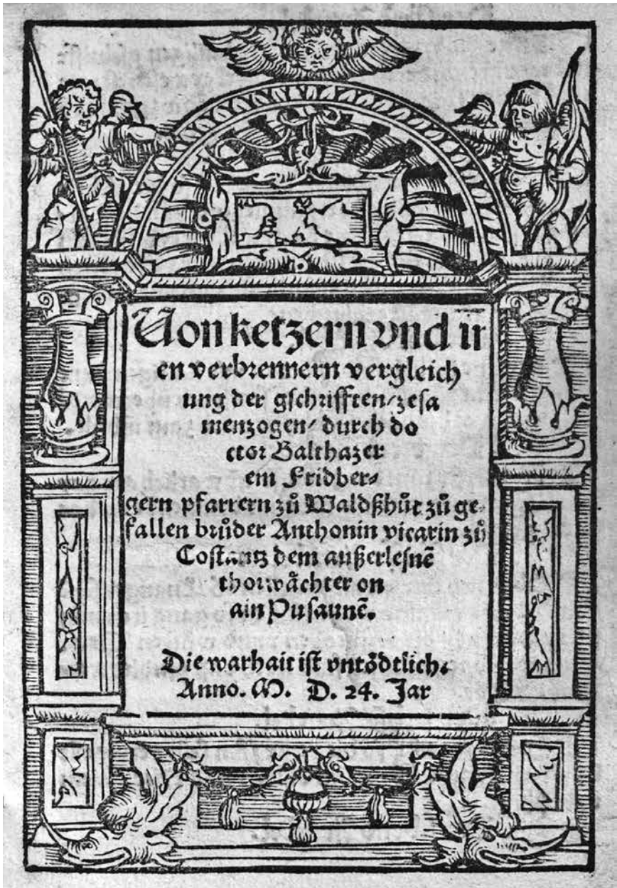
Titelpagina van Hubmaiers pamflet Von Kettern und iren Verbrennern (1524).