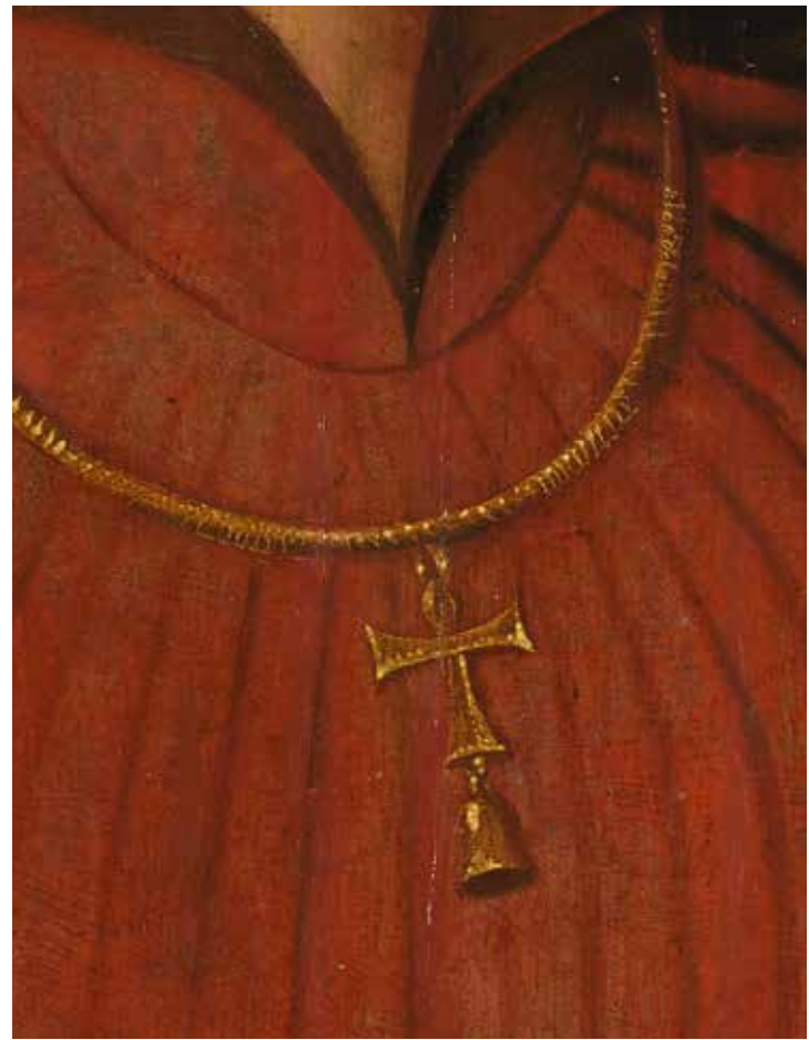
3. Detail: afb. 2, het Sint-Antonius ordeteken.

inkomsten eind 1466 definitief geregeld waren en er van een zelfstandige Scheveningse parochie gesproken kon worden. Huych Lambrechtsz. was vanaf 1419 de eerste eigen pastoor van de Scheveningse Antonius Abtkapel, welke in de loop van de 15 e eeuw vervangen zou gaan worden door een stenen Antonius Abtkerk.