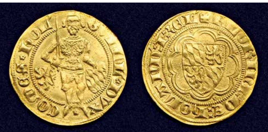
1. Hollandse goudgulden van Willem van Beieren, die als Willem V van 1348 tot 1389 tevens graaf van Holland was.

Ook nadat in 1419 de hoogstwaarschijnlijk houten Antonius Abtkapel tot Scheveningse parochiekerk verheven was, 7 bleven er wel conflicten op kerkelijk gebied ontstaan. Zo moest men nog steeds aan de pastoor van de Haagse St.-Jacobskerk, als schadeloosstelling voor het verlies aan inkomsten, jaarlijks een bedrag van 24 pond betalen. Na 1419 zijn er meerdere rechtszaken nodig geweest, eer de verdeling van de bezittingen en alle aanspraken op