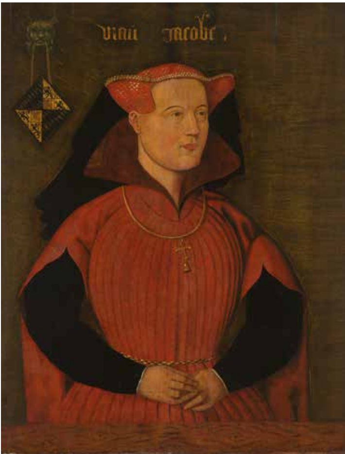
2. Portret van Jacoba van Beieren (olieverf, 64 x 50 cm, ca. 1490).