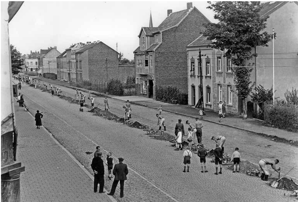
Kerkrade, Nieuwstraat-Neustrasse, oktober 1939 bouw grensafscheiding