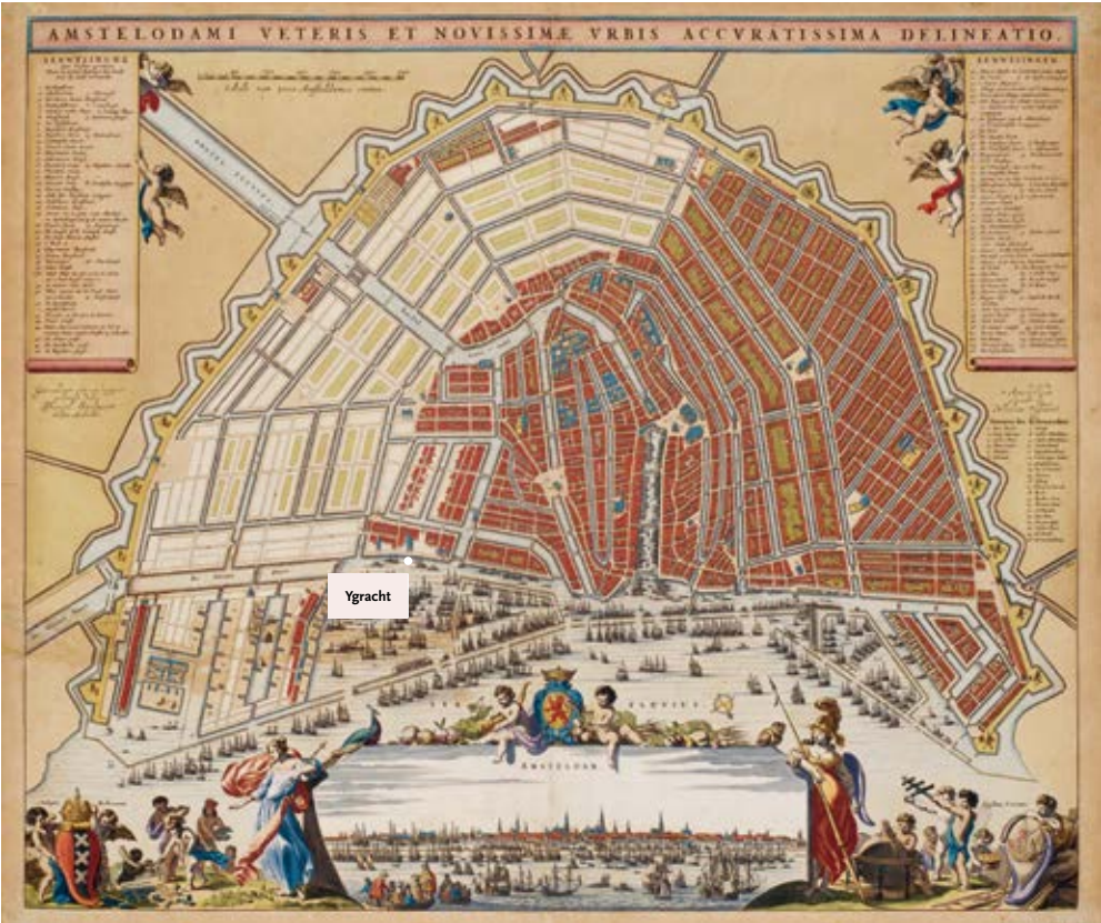
Afb. 1 Plattegrond Amsterdam.