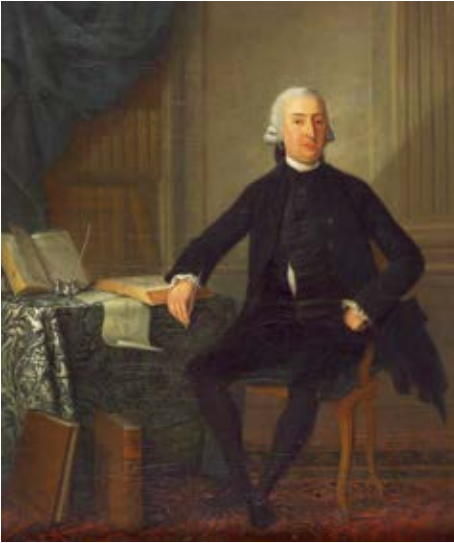
Afb. 5 Portret Guillelmus Titsingh.

voc-man. Hij stond aan de wieg van de Kweekschool voor de Zeevaart. Hij was een belangenbehartiger pur sang van de voc en de Amsterdamse koopliedenstand. Hij manoeuvreerde daarvoor tussen alle politieke partijschappen door. Hij werd tot zijn eigen verrassing na de Bataafse Omwenteling in 1795 gekozen tot Provisioneel Representant van het Bataafse Volk van Amsterdam.