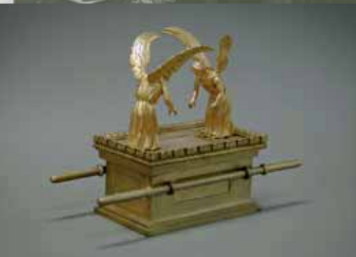
3. DEKERKE 1854, ORN 1863, HT 1879,