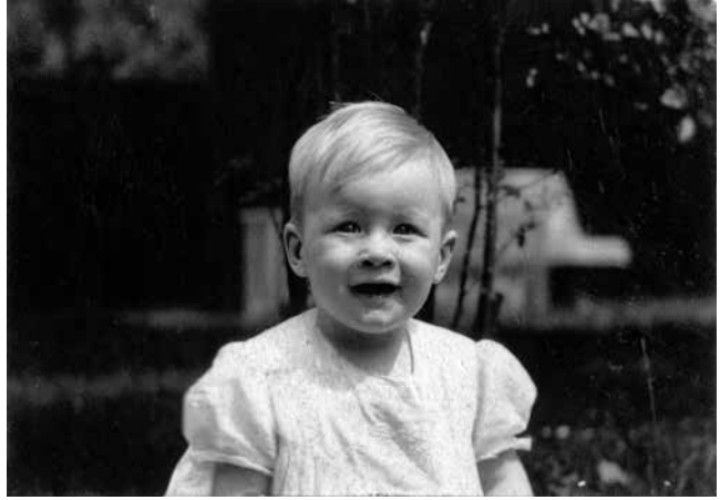
Binnert als peuter.