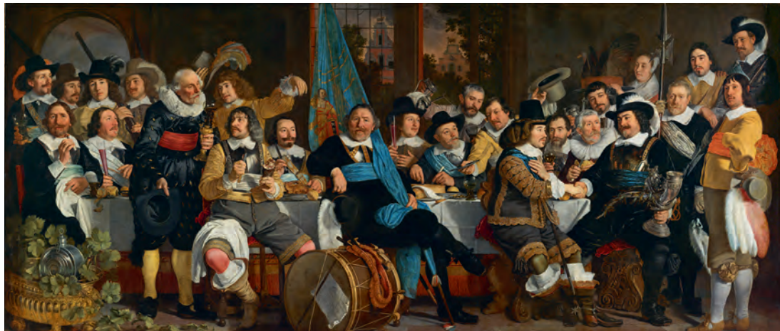
Afb. 3 Bartholomeus van der Helst, Schuttersmaaltijd ter viering van de Vrede van Münster, 1648.

Binnenhof in Den Haag. Zowel de ketel als de vaandels waren memorabilia met nationale bekendheid vanaf de zeventiende eeuw.