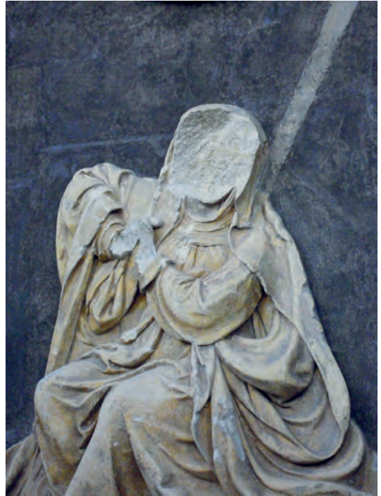
Afb. 4 Grafmonument van Frederik van Renesse in de Grote Kerk in Breda met sporen van de Beeldenstorm, ca. 1538.

Een ander deel had schade opgelopen, maar kon juist daardoor dienen als herinnering, bijvoorbeeld een deel van de botten van een heilige of een half verbrand heiligenbeeldje. Tot slot waren er voorwerpen die intact waren, zoals een kanonskogel.