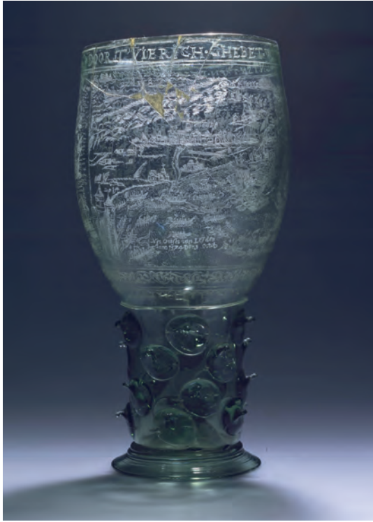
Afb. 1 Roemer met Leidens Ontzet en Beleg van Duinkerken, 1626.