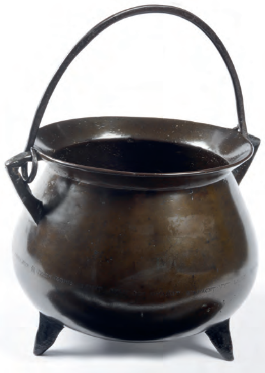
Afb. 2 Beroemde kookpot van het Beleg van Leiden, vóór 1574.

Het zijn niet slechts voorwerpen die een rol vervullen in verhalen over een gebeurtenis; het zijn voorwerpen die mensen actief aanzetten tot een bepaalde emotie of gedachte. Memorabilia zijn in de eerste plaats tastbare herinneringen. Het voorwerp vertelt iets over de eigenaar, de maker en de tijd waarin het werd gemaakt of bewaard. Soms is het verhaal duidelijk – het staat vermeld in de vorm van een inscriptie of kan worden afgeleid uit een document –, soms is het giswerk. Daarnaast zijn memorabilia gespreksstof. Een schilderij aan de muur lokt bijvoorbeeld een verhaal uit over de gebeurtenis die erop is afgebeeld. De eigenaar kent het verhaal uit de eerste, tweede of derde hand en past het misschien aan, maar hij of zij vertelt het naar aanleiding van het voorwerp. Verder hebben memorabilia en het bijbehorende verhaal een wederzijdse afhankelijkheidsrelatie. Hoewel sommige memorabilia zelfstandig bestaan, omdat het verhaal erop staat afgebeeld of beschreven, hebben de meeste een verhaal dat het voorwerp bijzonder maakt. De tragiek van memorabilia is dan ook dat ze zonder dit verhaal in de vergetelheid kunnen raken. Met het verhaal, daarentegen, kunnen memorabilia onderdeel worden van de lokale of nationale herinneringscultuur. Een mooi voorbeeld hiervan is de Leidse hutspotketel in Museum De Lakenhal (afb. 2) en de veroverde Spaanse vaandels in de Grote Zaal – nu Ridderzaal – op het