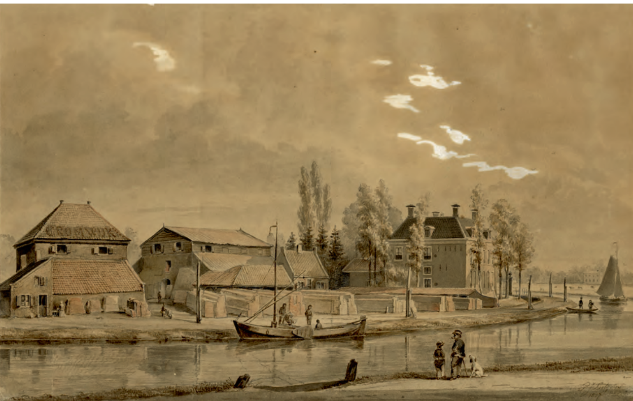
3. Steenoven Cromwijck. Prent van P.J. Lutgers (1857).

De vraag blijft of hier niet deels sprake is van een literair spel, van navolging van een klassiek literair genre gerevitaliseerd in de Renaissance, want dezelfde Amsterdamse regenten/kooplieden waren toch trots op de pracht en de macht van hun stad. Tegenover de literatuur van de hof- en lofdichten op het buitenleven waarin de stad een negatieve gevoelswaarde had, stond een literatuur waarin juist de lof werd gezongen van de stad. Schama noemt de lofzangen op de stad in de vele zogenoemde ‘lof en beschrijving’-boeken die in de zeventiende eeuw verschenen. ‘Tegen het midden van de zeventiende eeuw waren het, zoals te verwachten viel, de Amsterdamse lofredenaars die het meest lyrisch werden over hun woonplaats. Wanneer steden uit de oudheid werden aangehaald door de verzenmakers, konden ze nog niet in de schaduw staan van het stralende Amsterdam van die tijd.’ 10 Bij de opening van het stadhuis werd Amsterdam door Vondel het tweede Rome genoemd.