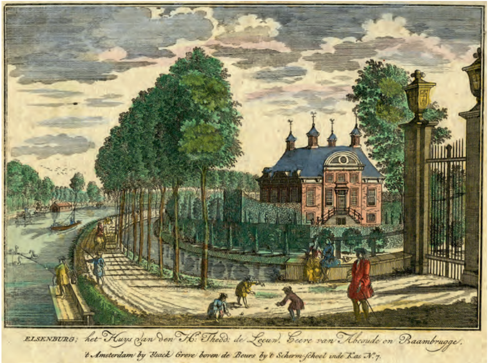
4. Gezicht op de Vecht met buitenplaats Elsenburg bij Maarssen. Uitgegeven door I. Greve in 1719.

Holland waren zij actief in de drooglegging van de grote meren en stichtten zij hofsteden die uitgroeiden tot buitenplaatsen. 11