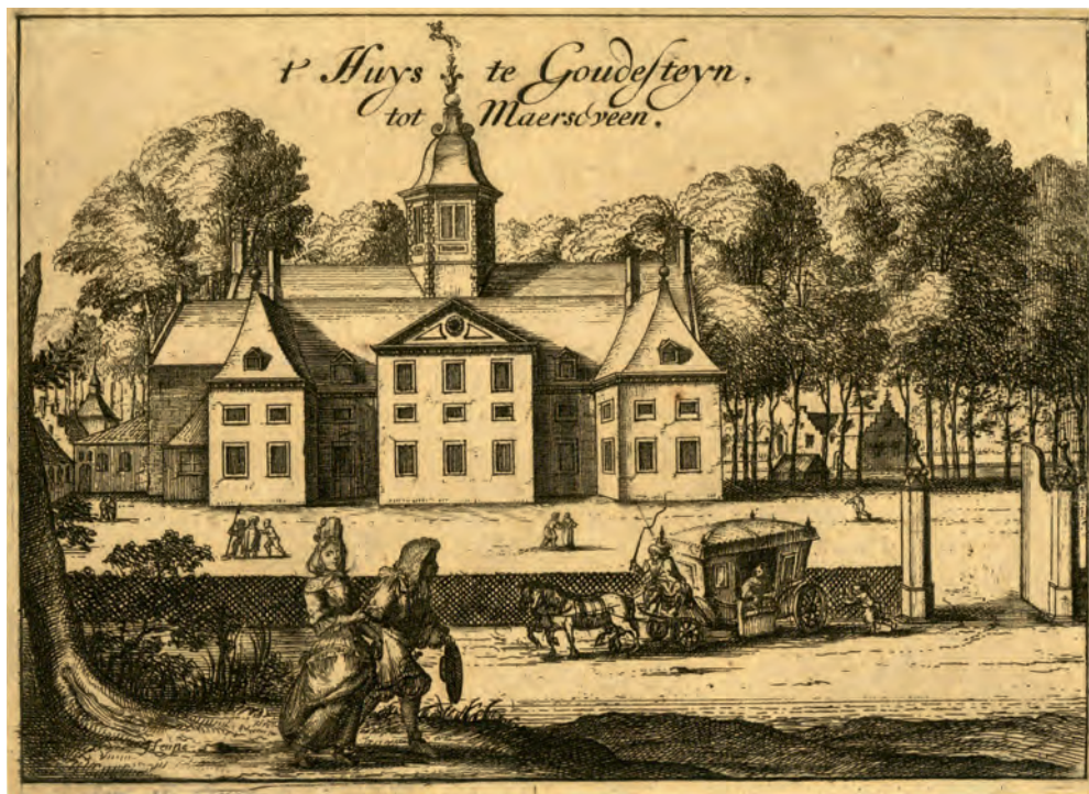
2. De nieuwe achterzijde van Goudestein uit 1645, mogelijk ontworpen door Philips Vingboons. Ets van I. Leupenius, 1690.

Holland en West-Friesland en toen de mogelijkheden daarvoor na ongeveer 1640 uitgeput waren, kwam de Vechtstreek in beeld. Onderzoek laat zien dat er een nauwe samenhang bestaat tussen de agrarische prijzen en het droogleggingswerk in Nederland. De periode van de grote inpolderingsactiviteit van 1540-1664 valt samen met de periode van hoge graanprijzen. Zakt de graanprijs, zoals het geval was in de beginperiode van de Tachtigjarige Oorlog 1565-1589 en in de periode 1640-1664, dan zakt ook de inpolderingsactiviteit in. 7