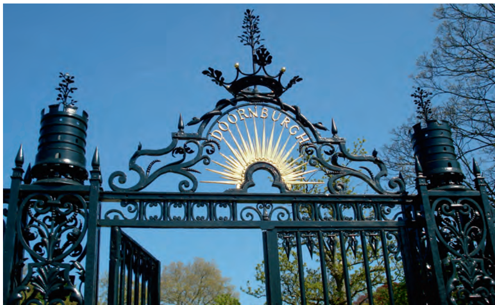
1. Dit smeedijzeren hek stamt vermoedelijk uit circa 1730. Waarschijnlijk heeft Theodorus de Leeuw, eigenaar van Elsenburg II, het hek laten plaatsen. Uit de twee burchten op het hek steken elzentakken en geen doornentakken.

Achter deze naam gaat de geschiedenis schuil van een buitenplaats – in feite drie buitenplaatsen met dezelfde naam – die bijna 175 jaar lang heeft gelegen op de gronden van het huidige Doornburg. Die geschiedenis begint bij Joan Huydecoper (1599-1661) – rijk koopman en burgemeester van de stad Amsterdam – die zijn erfgoed, de hofstede de Gouden Hoeff, in 1628 uitbouwt tot het buitenhuis Goudestein. Hij koopt in de jaren die volgen, ook de omliggende gronden op en realiseert daarop zo’n veertigtal buitenplaatsen. De eerste van deze buitenplaatsen was Elsenburg, dat in 1637 wordt ontworpen door de bekende classicistische architect Philips Vingboons. Vooral het laatste Elsenburg, Elsenburg III, moet een grandioos huis zijn geweest. Een tijdgenote schreef na een bezoek aan dit Elsenburg in haar dagboek: ‘Toen we naar huis terugreden, dacht ik: ik heb nu tenminste de voldoening dat ik het mooiste huis heb gezien dat er in de Republiek bestaat.’ Maar ook dit grandioze huis onderging