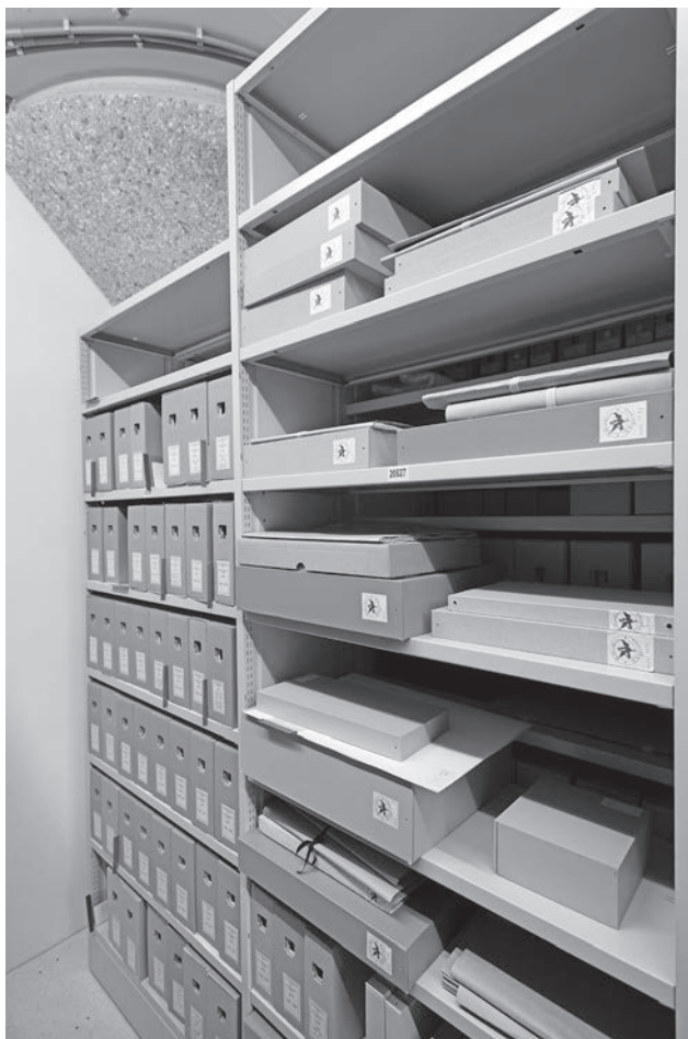
Afb. 3 Moderne berging van het archief in de kluis van de Leidse Universiteitsbibliotheek.