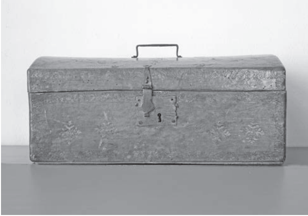
Afb. 4a en b Twee kistjes, waarin waarschijnlijk de belangrijkste bescheiden uit het archief, zoals het testament van Johannes Thysius en de eigendomspapieren van landerijen waren opgeborgen.