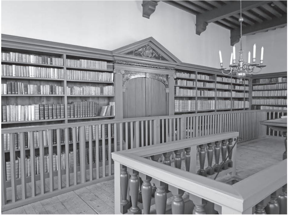
Afb. 1 Interieur van de Bibliotheca Thysiana, met in het centrum de kast waarin het archief werd bewaard. In de fronton is het wapen van de familie Thysius zichtbaar.