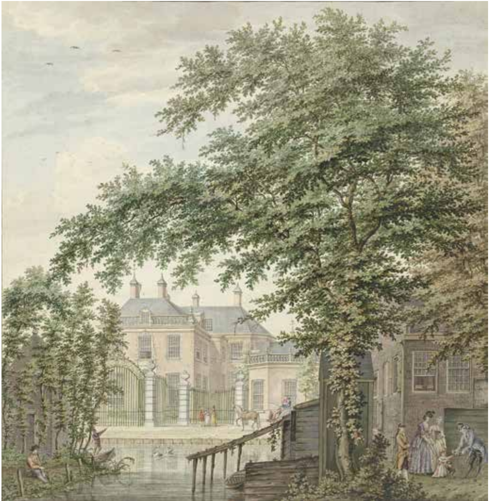
H.P. Schouten, Gezicht op het huis Luxemburg bij Maarssen aan de Vecht.