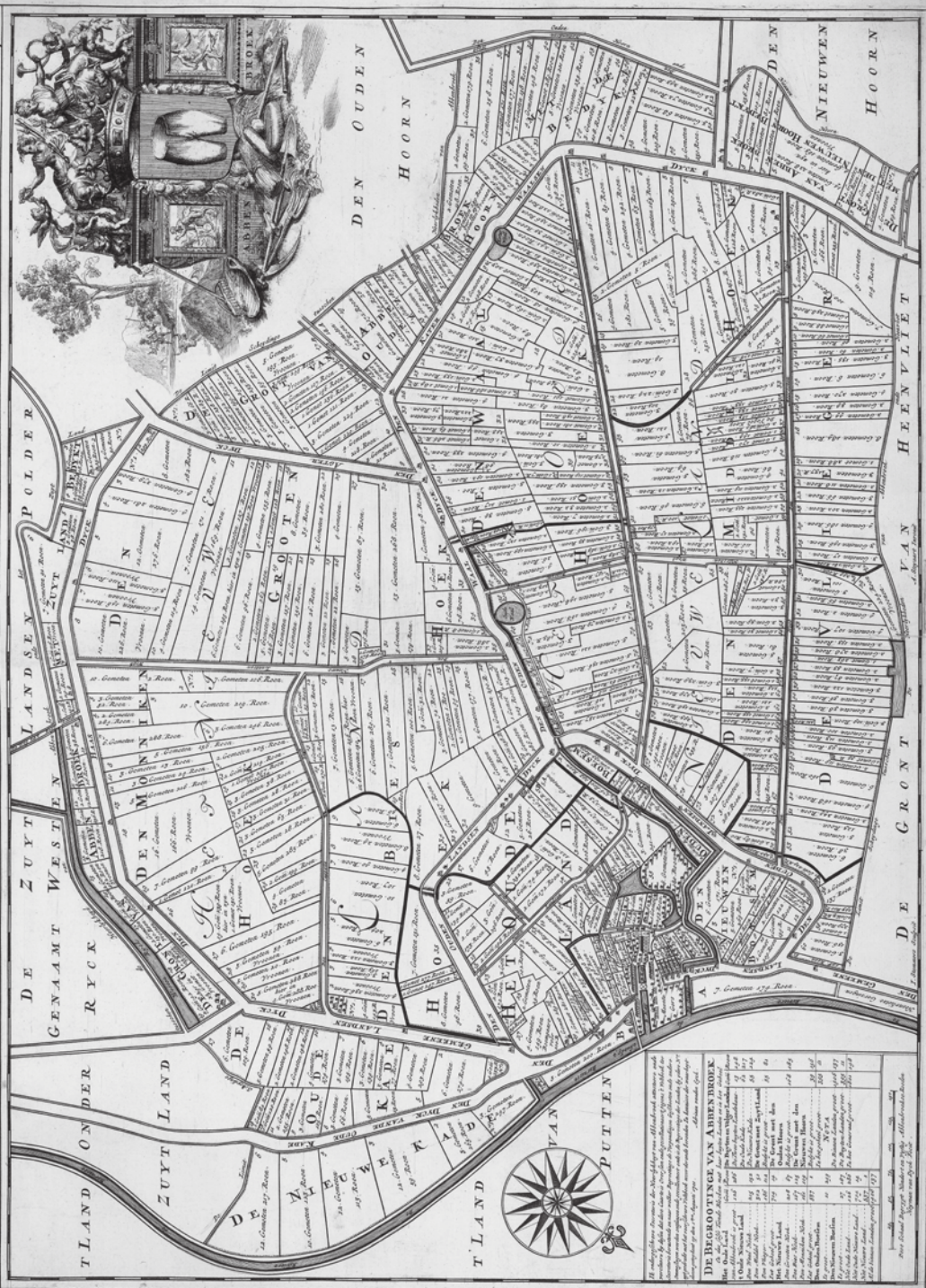
Afb. 1 Kaart van de heerlijkheid Abbenbroek. Jan Stemmers, naar ontwerp van A. Steyaart, 1701. (NA)