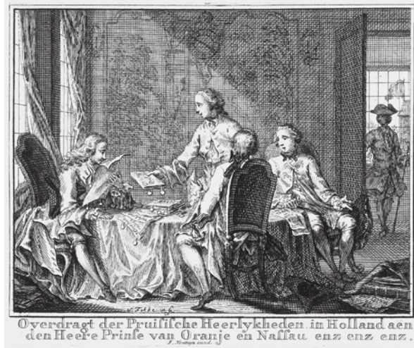
Afb. 3 Verkoop van de Pruisische heerlijkheden aan Willem V. Simon Fokke, 1754.