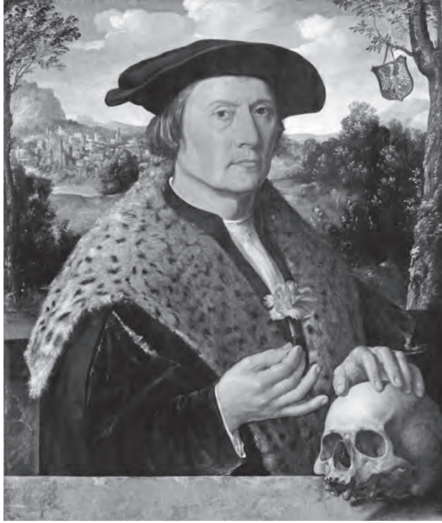
Afb. 1 Dirck Jacobsz, Portret van Pompeius Occo, 1531. Olieverf op paneel, 66 x 54 cm. Amsterdam, Rijksmuseum, inv. nr. 3924.

verdiepten zij zich in klassieke talen en letteren, welsprekendheid, filosofie en geschiedenis, bestudeerden de door Occo beheerde schriftelijke nalatenschap van de beroemde humanist Rudolf Agricola en onderwezen de kinderen van de stedelijke elite in het werk van Romeinse schrijvers als Livius, Seneca en Cicero. Hieruit konden de jongelingen de burgerlijke deugden leren die zij later als bestuurders nodig zouden hebben: gematigdheid, eerbaarheid en wijsheid. De koopmansstad Amsterdam werd zo ook een stad van kunstenaars, drukkers en humanistische geleerden.