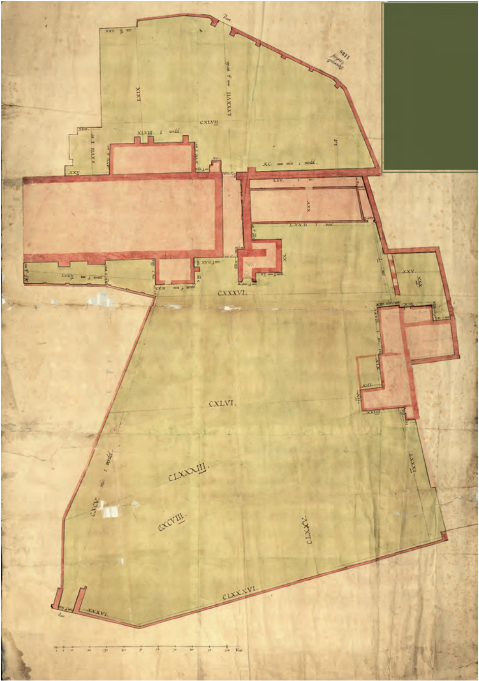
Afb. 3 Plattegrond van de Bisschopshof te Deventer, bij de noordzijde van de Lebuinuskerk aansluitend (Stadsarchief en Athenacumbibliotheek Deventer).