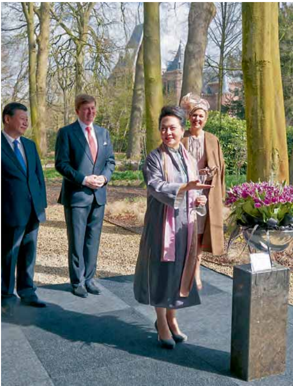
Afb. 3 Voor de naamgeving van een nieuw gekweekte tulp, Cathay, kwam de president van de Volksrepubliek China, begeleid door koning Willem-Alexander en koningin Maxima, op 23 maart 2014 naar kasteel en landgoed Keukenhof.