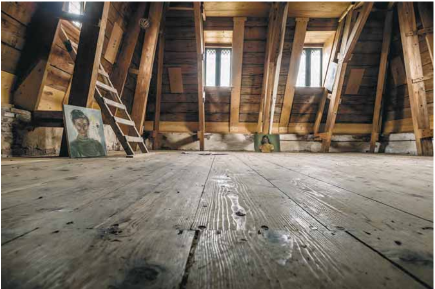
Afb. 2 De rondgang bij de tentoonstelling 'Verborgene verhalen' langs de sfeervolle foto's die Eric de Vries van het kasteelinterieur maakte, had als 'hoogtepunt' de zolder van de hoofdstoren.