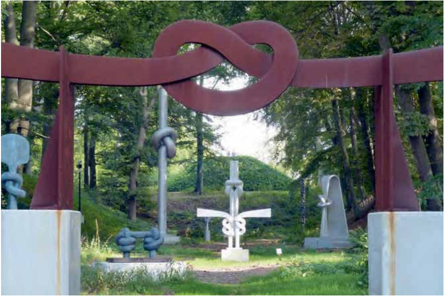
Afb. 1 De tentoongestelde werken van de Japans- Amerikaanse kunstenaar Shinkichi Tajiri worden gekenmerkt door 'de knoop' als centraal motief. Hij ziet daarin het symbool van eenheid, harmonie en verzoening.