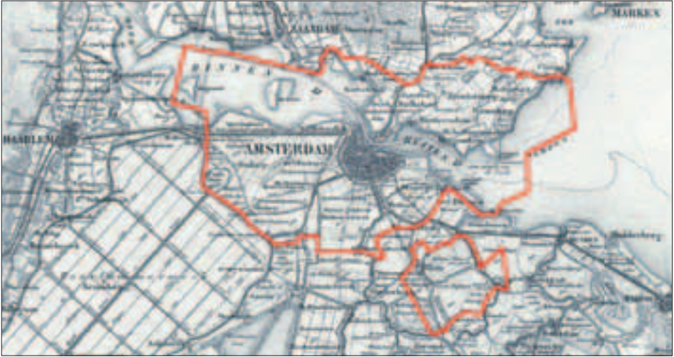
► 1.1 Het onderzoeksgebied in het midden van de negentiende eeuw. De huidige gemeente Amsterdam (gemeentegrens in rood) beslaat een aanzienlijk deel van het onderzoeksgebied. Topografie: TMK 1867.

De geschiedenis van de Zaanstreek tot ca. 1350 hoort hier ook bij, maar is door ons elders beschreven. 5 Om de voorgeschiedenis van het westelijk deel van het Amsterdamse grondgebied te kunnen begrijpen, was het noodzakelijk om de ontstaansgeschiedenis van het Haarlemmermeer te onderzoeken: niet alleen om na te gaan welke gebieden in de loop der eeuwen in dat steeds groter wordende meer zijn verdwenen, maar ook om te achterhalen hoe die verdrinken landerijen in de middeleeuwen oorspronkelijk waren ingericht. Delen van Amsterdam-West liggen op vanouds Kennemer grondgebied. Het zuidelijk deel van Waterland is begin vorige eeuw binnen de gemeentegrenzen van Amsterdam getrokken. Voor Amsterdam-Noord geldt dat alleen met kennis van de geschiedenis van heel Waterland de middeleeuwse ontginnings-, bewonings- en waterstaatsgeschiedenis van dat gebied begrepen kan worden. De ontstaansgeschiedenis van de oude middeleeuwse kern van Amsterdam is vanzelfsprekend nauw vervlochten met die van Amstelland, maar ook de gebieden aan weeszijden van de Vecht leveren informatie op die van belang is om het hele onderzoeksgebied historisch-geografisch beter te doorgronden.