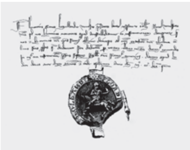
► 1.2 Het tolprivilege van 1275. In de tweede regel worden de 'homines manentes apud amestelledamme' genoemd.

De geschiedschrijving van Amsterdam kent een lange, trotse traditie. Vele historici hebben zich beziggehouden met de gloriejaren van Amsterdam als handelsmetropool. Slechts enkelen hebben zich meer toegelegd op het ontrafelen van de oudste geschiedenis van de stad, of haar vóórgeschiedenis. Zonder befaamde zeventiende- en achttiende-eeuwse stadshistorici als Isaac Commelin en Jan Wagenaar tekort te willen doen was het Jan Ter Gouw die in de