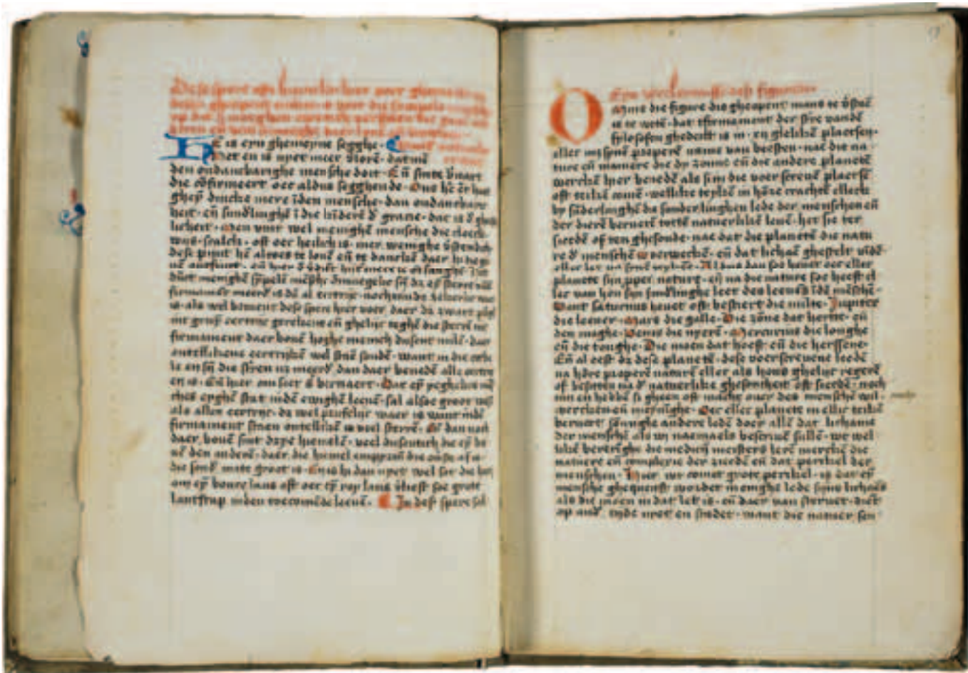
▲ Afb. 1.1 Verwijzing naar een afbeelding die er niet meer is. Eyn corte decleringhe deser sere, vijftiende eeuw, vervaardigd in het klooster Ter Nood Gods (Tongeren). Brussel, Koninklijke Bibliotheek van België, IV 27, fol. 12v-13r.