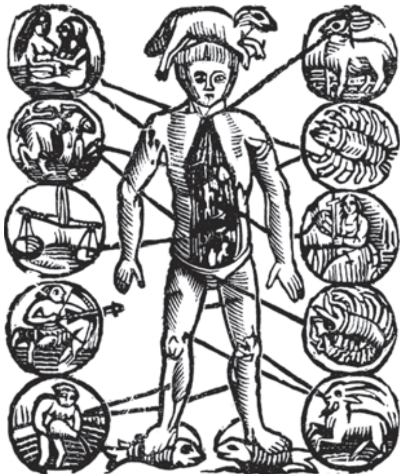
▲ Afb. 1.2 Zodiakman uit een gedrukte Schaapherderskalender , begin zestiende eeuw. Dertig jaar geleden werd deze afbeelding in een editie gebruikt om een indruk te geven van de ontbrekende zodiakman in Eyn corte decleringhe . Uit: Schotel 1873 (reprint 1975), 13.

bruik? Zelfs bij afbeeldingen die ontbreken kunnen een heleboel vragen gesteld worden.