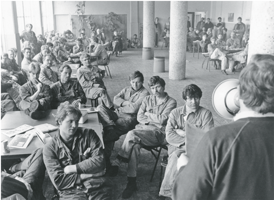
Acties bij het CAO overleg Hoogovens, jaren zeventig. (NHA)