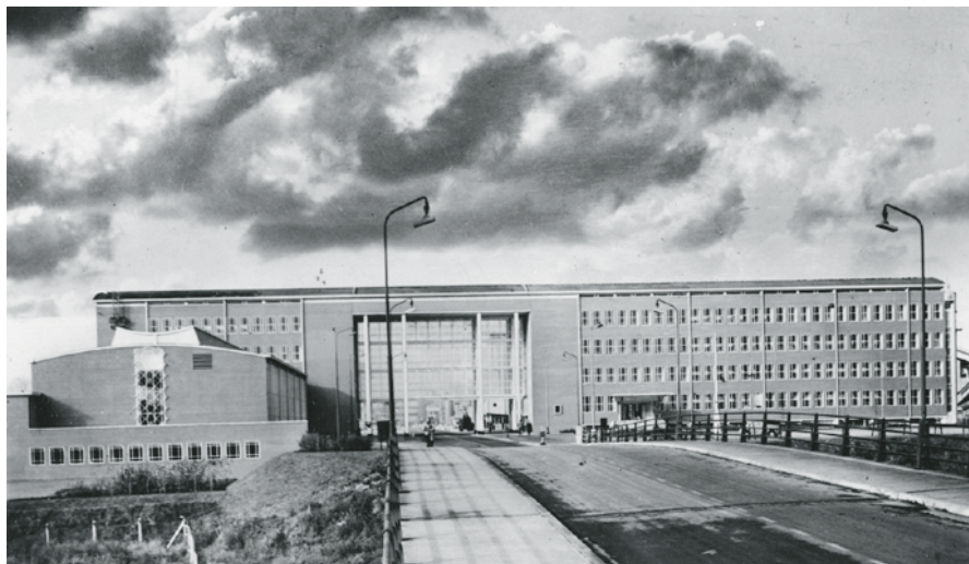
Hoofdkantoor Kon. Ned. Hoogovens & Staalfabrieken N.V., 1951.