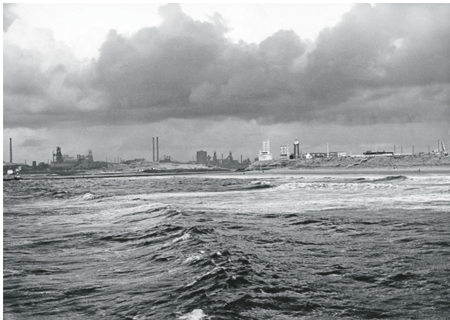
Hoogovens en zijn opvolgers domineren de kustlijn. (NHA)