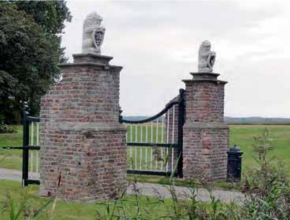
Het hek van de hofstede Zandvoort bij Middelburg. Foto M. van den Broeke, 2012.