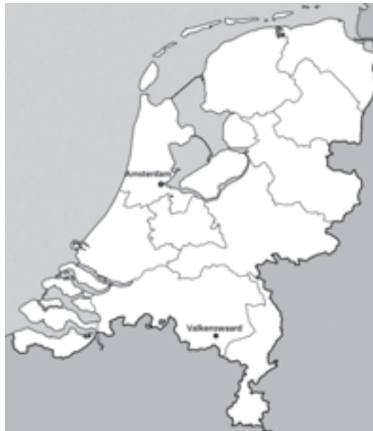
Afb. 1.2 Valkenswaard, gelegen in de provincie Noord-Brabant.

De huidige gemeente Valkenswaard ontstond op 1 mei 1934 door samenvoeging van de tot dan toe zelfstandige dorpen Borkel en Schaft, Dommelen en Valkenswaard. Na een bloeiperiode te hebben gekend tussen 1550 en 1750 vanwege de valkerij, maakte Valkenswaard vanaf 1865 een snelle industriële ontwikkeling door, waarbij de plaatselijke tabaksnijverheid na 1880 een bepalende factor werd. In 1920 was in deze arbeidsinten-