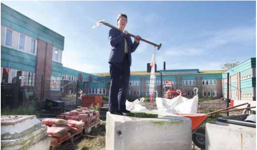
Afb. 4 De waterramp heeft ook een voordeel: in 2011 verrijst naast de studiezaal een nieuw depot.

Na het evacueren en invriezen van de archiefstukken volgt een langdurig en gecompliceerd traject van het maken van plannen, drogen, schade-inventarisatie, herstel en restauratie van de stukken. Maar ook van bestuurlijke, juridische en financiële procedures over aansprakelijkheid.