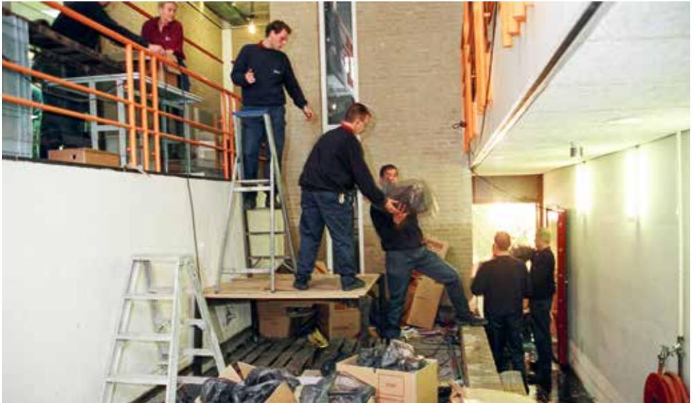
Afb. 1 Vrijwilligers geven in een lange menselijke keten de kletsnatte archiefstukken aan elkaar door.